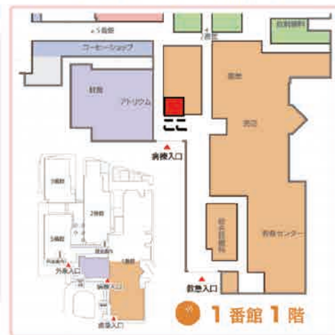
1 番館 1 階 売店付近

面接相談・電話相談 に対応しております。 予約不要。ご本人、ご家族、お友達、どなたでも。