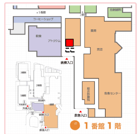
1 番館 1 階 売店付近

※医療にかかる総合的な相談等は、相談支援センターへお願いします。 ※医療相談ではありません。セカンドオピニオンの提供、医師、病院等の紹介は行っておりません。 ※ピアサポートの内容は、守秘義務のもと保護されます。